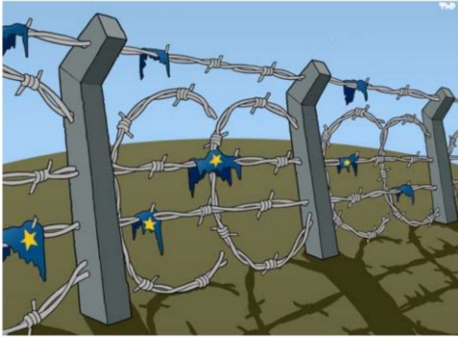
Royaards (Pays-Bas), 2014

L'Europe n'accueille pas facilement les réfugiés : le drapeau européen est en lambeaux (morceaux) et les barbelés ont la forme du sigle de l'euro : €