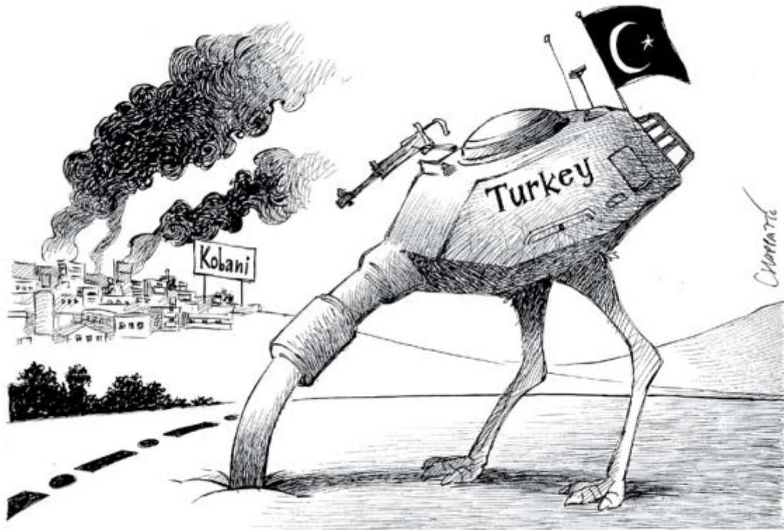
Chappatte (Suisse), 2014