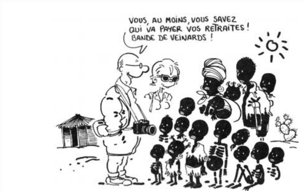
Des touristes européens dans un pays où les pensions n'existent sans doute pas. Le dessin est ironique. Plantu (France), 2007