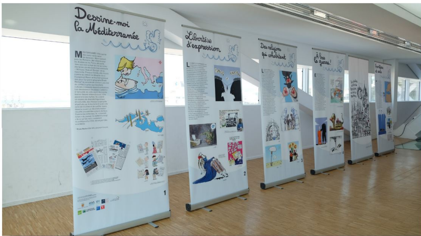
Quelques-unes des 12 affiches-panneaux de l'exposition.